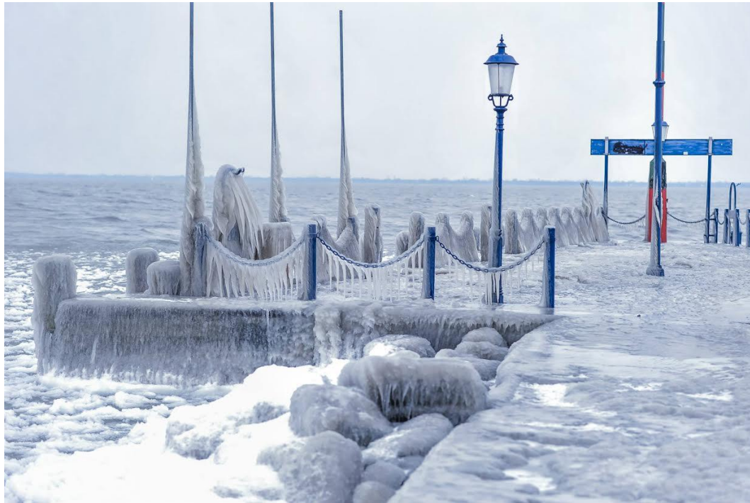
Tél tábornok seggest ugrott a magyar tengerbe